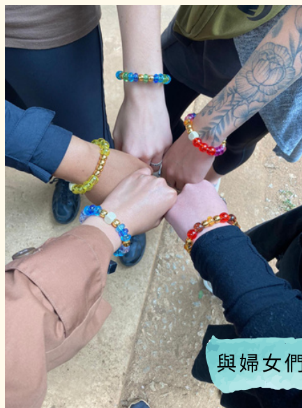
與婦女們一同製作手鏈

感恩神讓我們有合一的團隊，面對這些衝擊，我們仍能有智慧地處理，而且她們對我們到來也表示歡迎和接納，透過簡單的活動和對話，我們很真誠地建立了跨文化友誼！