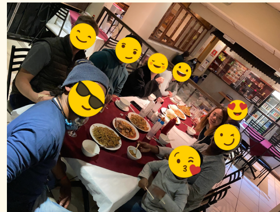
除學習以外，我們也有Family group，定期聚會及團契相交

然而，神在我文化適應的過程中，教導我專注聆聽，從別人身上學習，我體會到平日在香港過於急速，有時著重於「做」（Doing），過於「生命」本身（Being），我嘗試放慢步伐，存更開放的心擁抱異文化，以及聆聽每一個人截然不同的宣教故事。