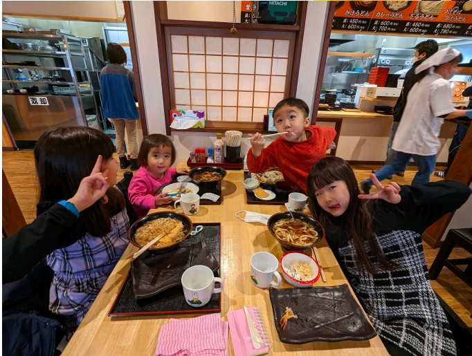
冬天的兒童食堂在本地的烏冬店進行， 每次30人份孩子們大滿足