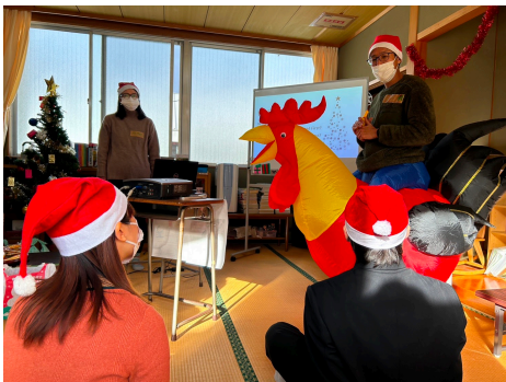
住田高校服侍，聖誕同歡

我不能說出我們未來有甚麼計劃，具體的會如何跟本地學校合作，有多少次兒童公園伴玩，兒童食堂，又或者甚麼時候再開MTC，但是，我肯定當我們的團隊預備好的時候，神就會把認出我們是門徒的生命加給我們。社區中仍然有好些需要，特別是暑假時，工作的相親無法照顧他們的孩子。我們正在禱告，希望嘗試開辦一個暑期密集的兩三星期的假期聖經學校，一方面回應需要，一方面找機會緊密的與孩子同行。這是一個小計劃，也會跟七月八月的短宣隊配搭，請你為此禱告，也求神感動你能親身來細看在此的作為。