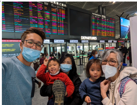
母親到訪，疫情以來團聚

請支持我們的生活： 進入2023年開始，我們一家四口在日本的支出（包括生活費、外出訓練及會議等）每月需要4.5萬港元。我們的母會沙崙堂宣教基金將支持我們40%，其餘數有賴神的供應。我們盼望神感動你以經濟回應支持我們在日本的宣教生活。沙崙堂會全力協助管理我們所收到的奉獻。