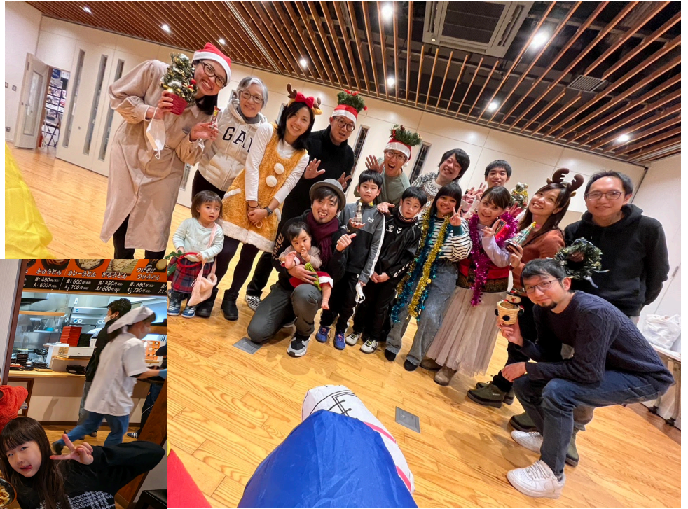
OLD聖誕聯歡，中美日菲非常國際化