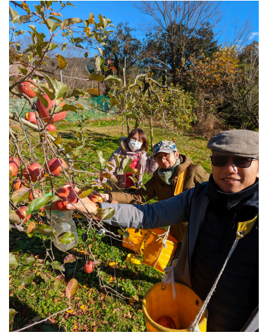
幫忙收割蘋果，果真作工的人少

景、喜好、專攻、性格都非常不同，卻是我們多年來禱告祈求的人材，補我們的不足，擴張神的國度的希望越發精彩。